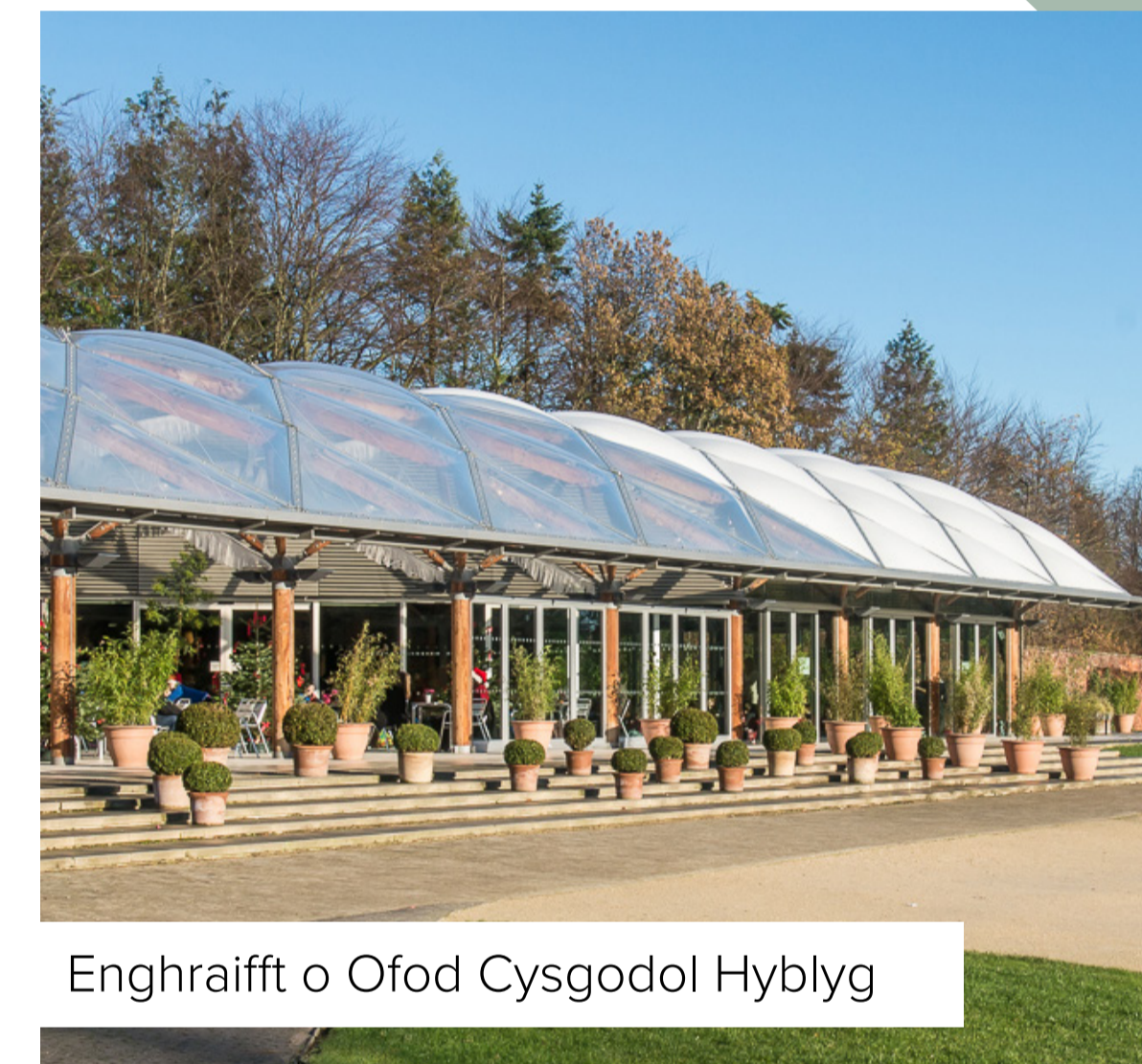
Enghraifft o Ofod Cysgodol Hyblyg