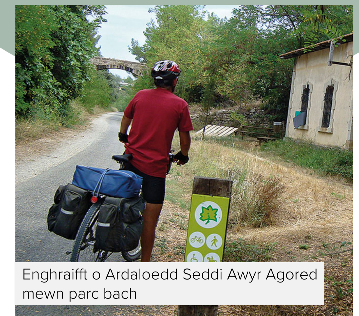
Enghraifft o Ardaloedd Seddi Awyr Agored mewn parc bach