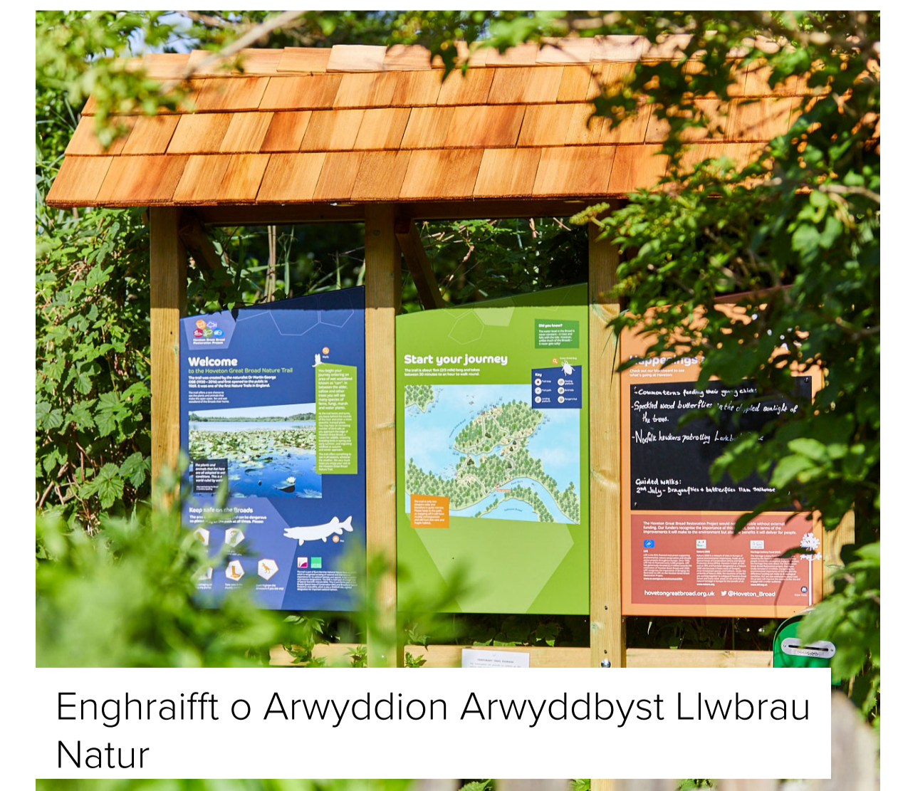
Enghraifft o Arwyddion Arwyddbyst Llwybrau Natur