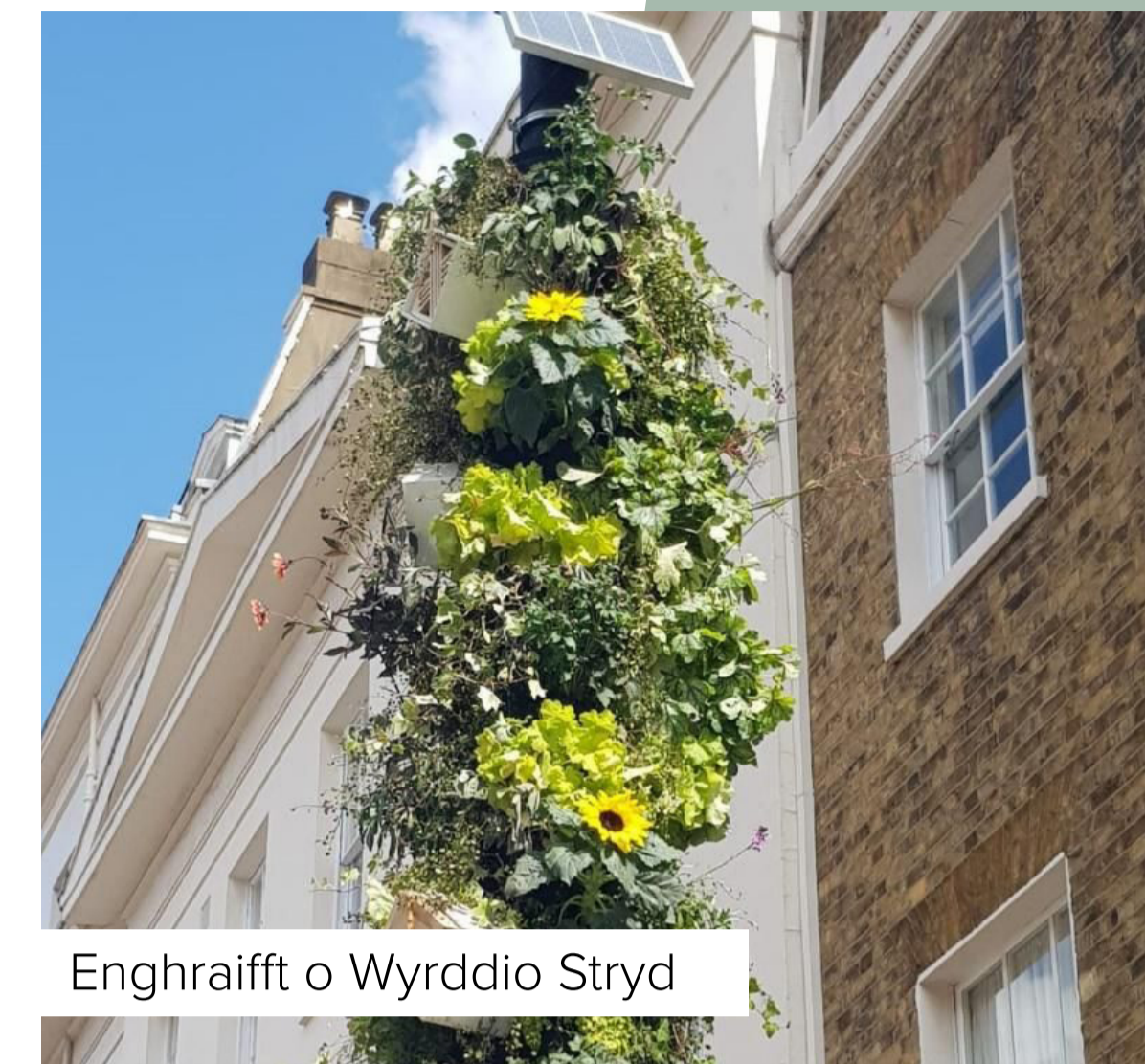
Enghraifft o Wyrddio Stryd