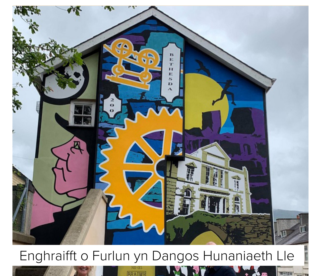
Enghraifft o Furlun yn Dangos Hunaniaeth Lle