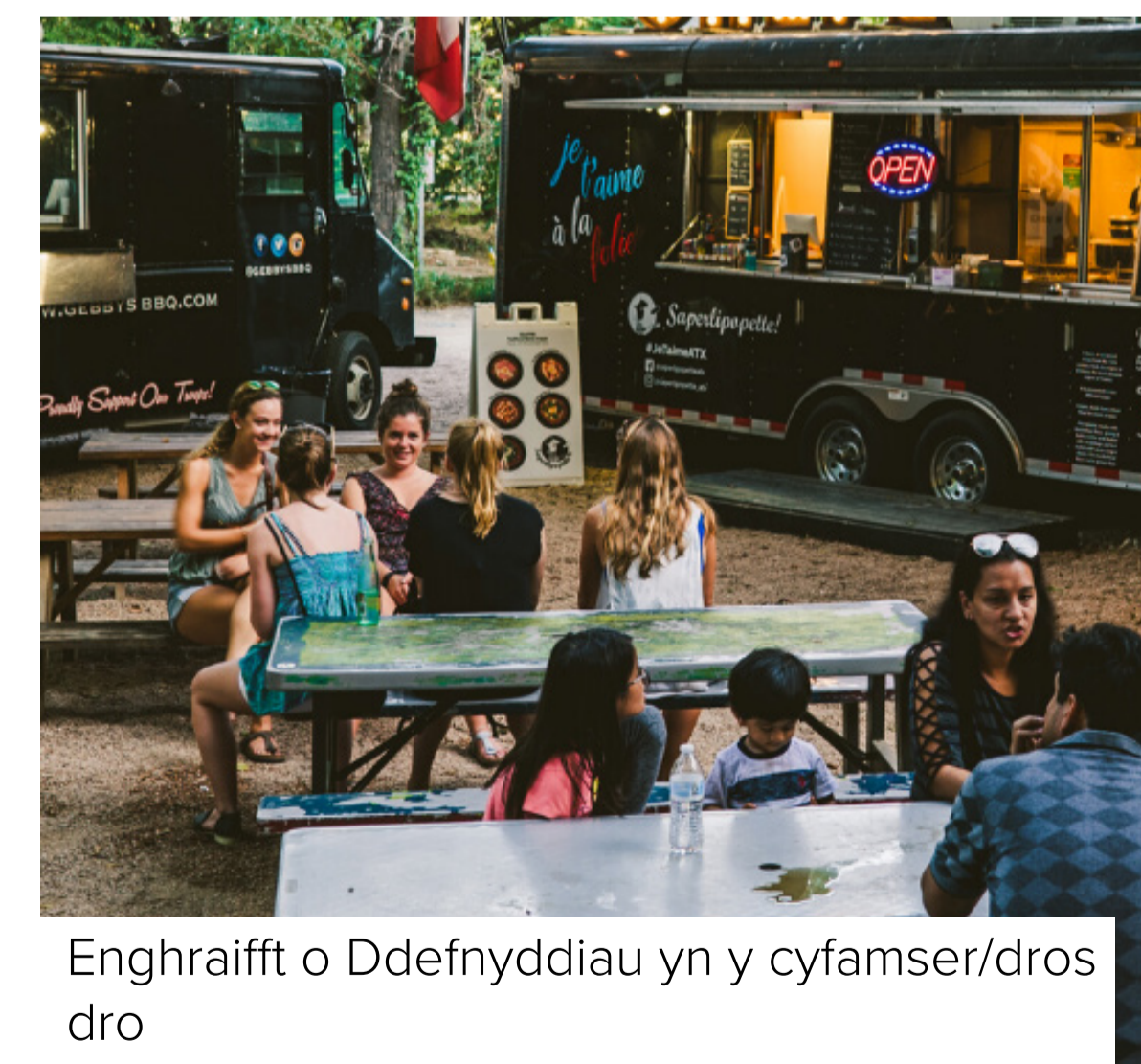
Enghraifft o Ddefnyddiau yn y cyfamser/dros dro