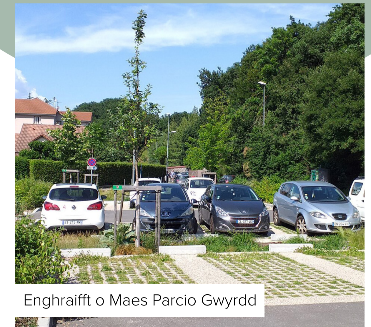
Enghraifft o Maes Parcio Gwyrdd