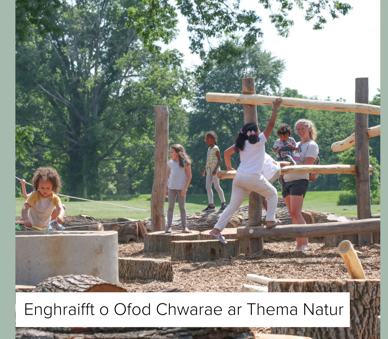
Enghraifft o Ofod Chwarae ar Thema Natur