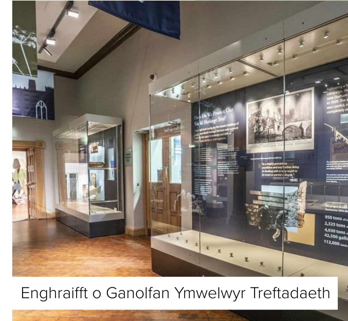
Enghraifft o Ganolfan Ymwelwyr Treftadaeth