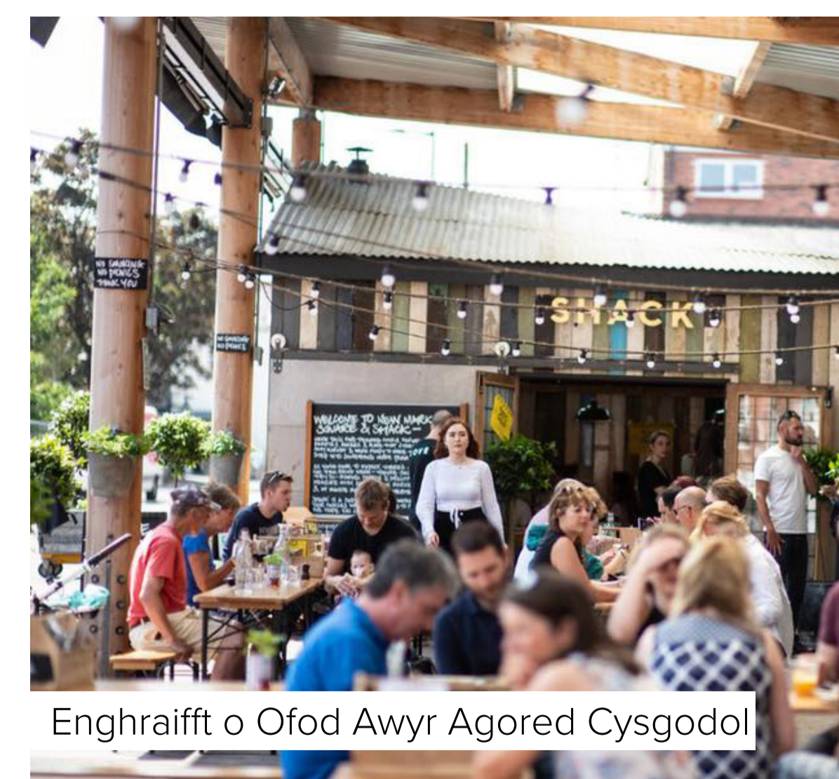
Enghraifft o Ofod Awyr Agored Cysgodol