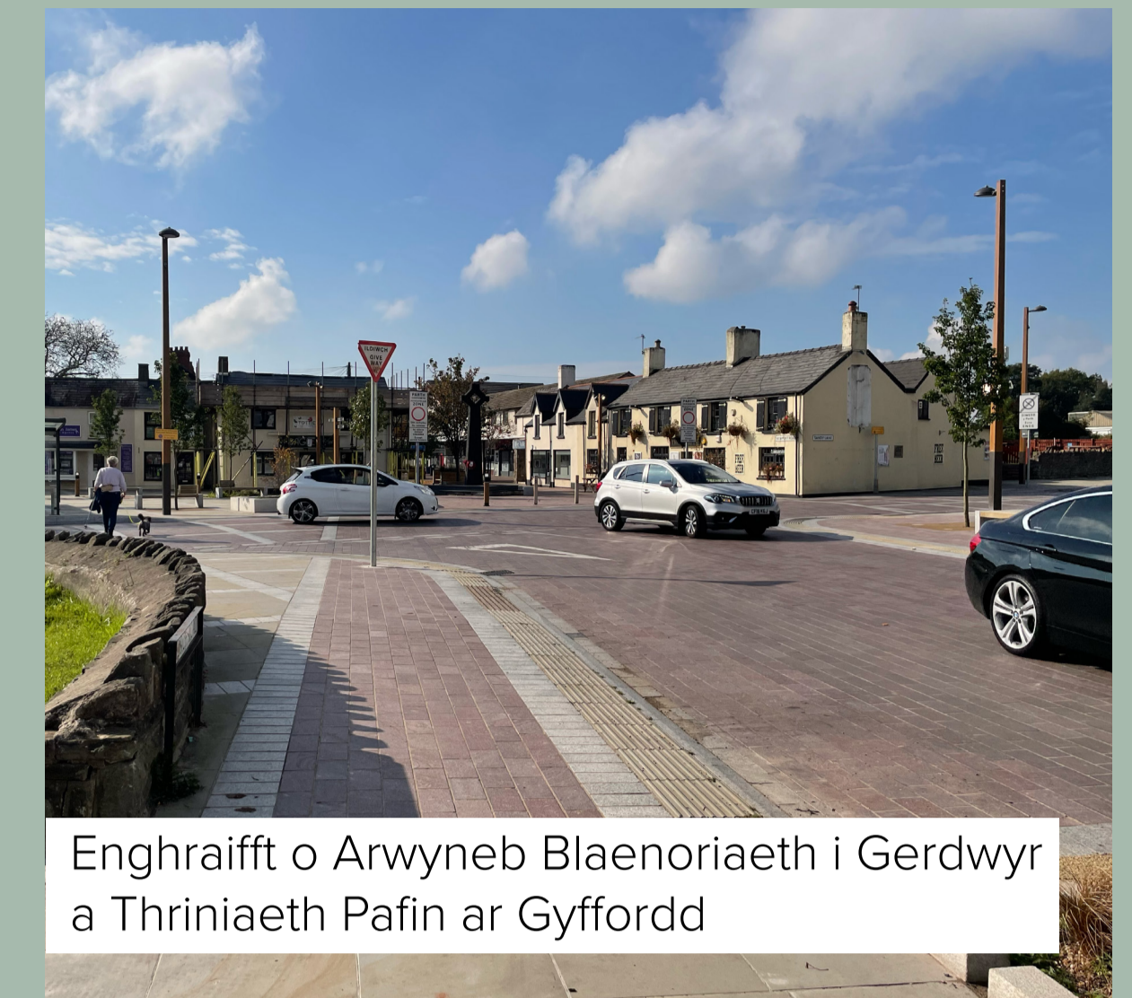
Enghraifft o Arwyneb Blaenoriaeth i Gerddwyr a Thriniaeth Pafin ar Gyffordd