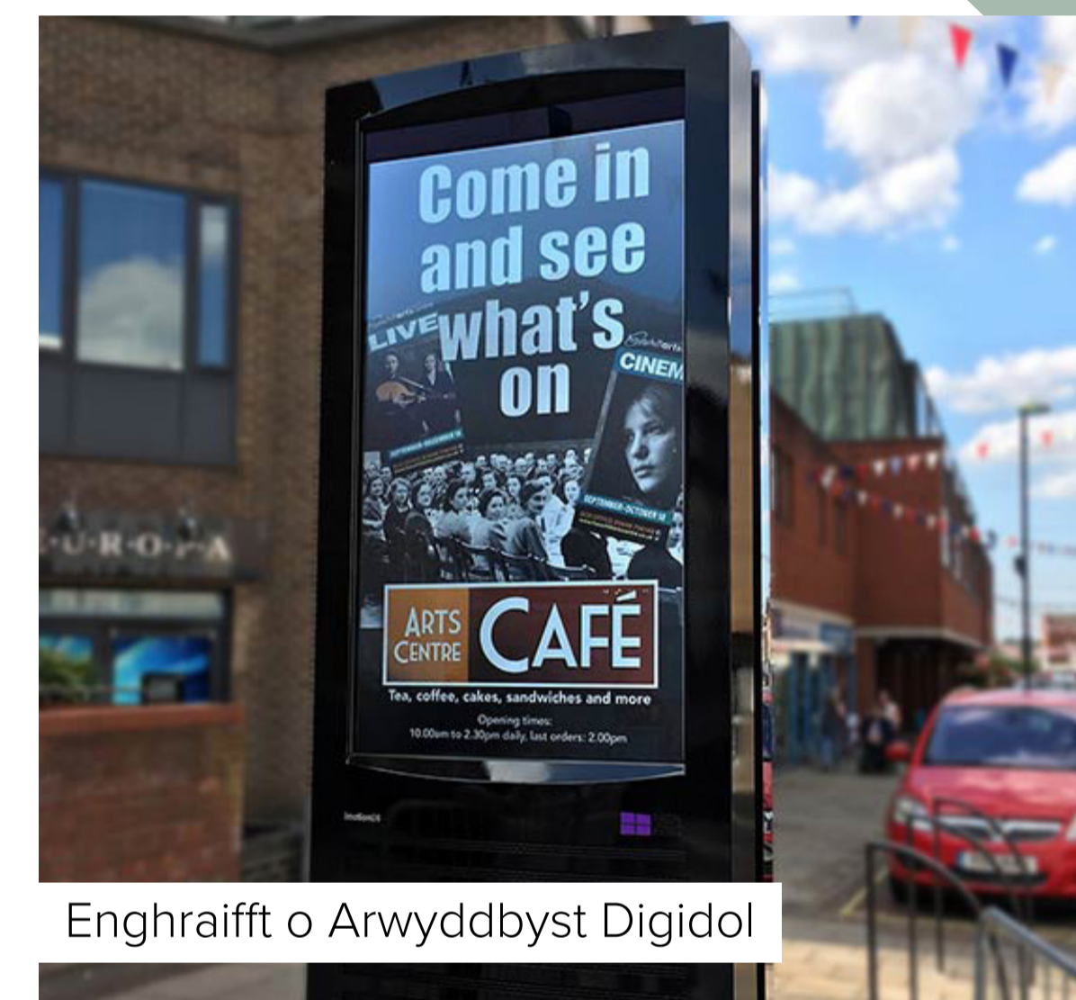
Enghraifft o Arwyddbyst Digidol